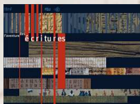
L'aventure de l'écriture

Présentation et visite guidée de deux expositions virtuelles de la Bibliothèque Nationale de France :